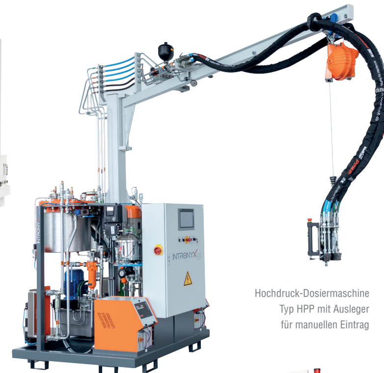
Hochdruck-Dosiermaschine Typ HPP mit Ausleger für manuellen Eintrag